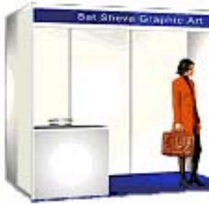
המחשה של ביתן בנוי 6 מ"ר